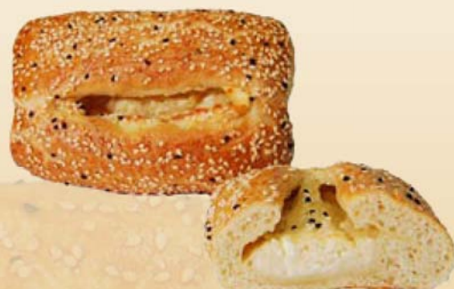
Börek Weißkäse Art.Nr.: 41105