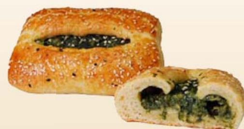
Börek Spinat Art.Nr.: 41305