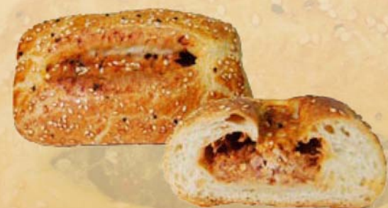
Börek Thunfisch Art.Nr.: 41205